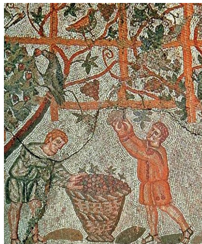
Mosaico di una villa romana Museo del Bardo di Tunisi

Considerato come il più nobile dei vitigni bianchi, la sua uva veniva anticamente chiamata Aminea gemella perché sviluppa un gran numero di grappoli doppi.